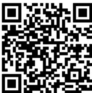
Google Play 下载二维码